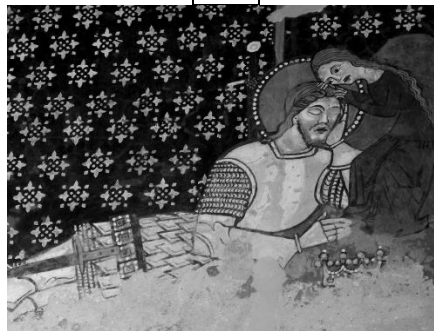
A legenda pihenés-jelenete. Székelyderzs, unitárius templom

https://www.szentlaszlo.com/gallery.szekelyderzs.php