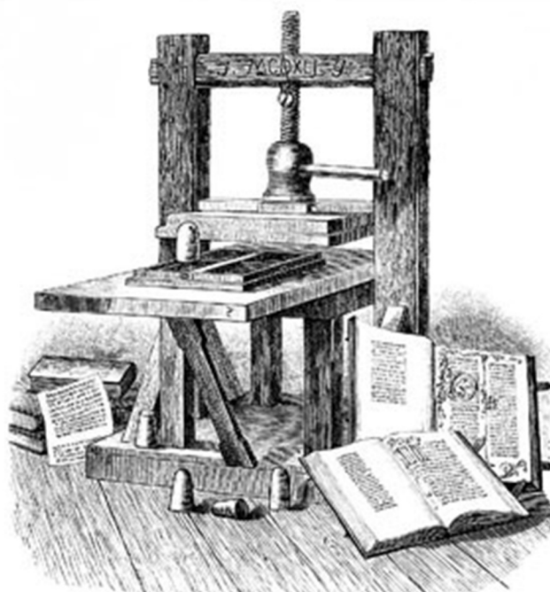
3. kép _____