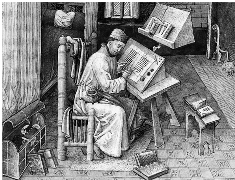
2. kép _____