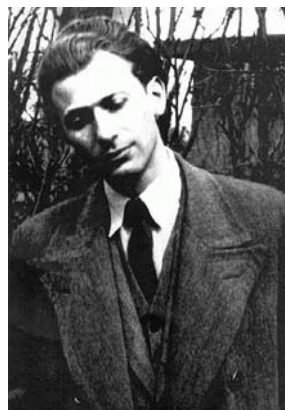
Radnóti Miklós (1909–1944) költő, műfordító

(Lager Heidenau, Žagubica fölött a hegyekben, 1944. augusztus 8.)