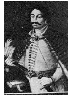
Balassi Bálint (1554–1594) költő